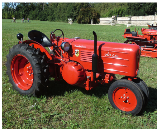
OTO 18 TRE RUOTE