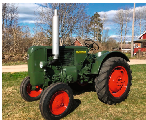
BOLINDER BM 10