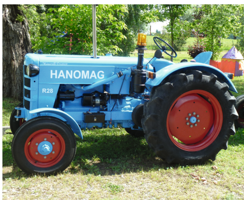
HANOMAG R 28