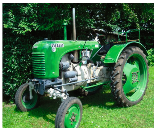
STEYR D 80