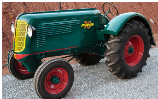
OLIVER 70 STANDARD