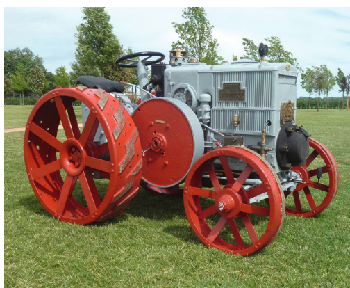
OM T 240