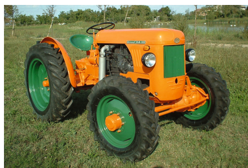
SAME DA 25 DT