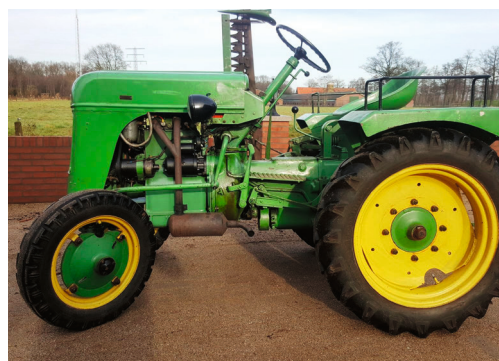
BAUTZ AS 120